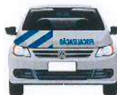
veículo - | adesões em: carro tipo popular | placa: fiscalização