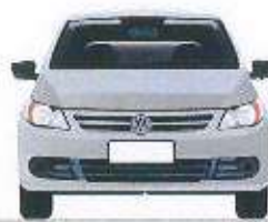
veículo - | adesões em: carro tipo popular | placa: 001